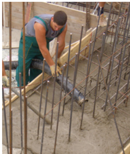
La P 718 refoule entre autres du béton fin jusqu'à une granulométrie de 32 mm.

La P 718 est donc une pompe à béton pour bétons fins incroyablement polyvalente que vous pouvez toujours utiliser lorsque l'espace sur le chantier est restreint.